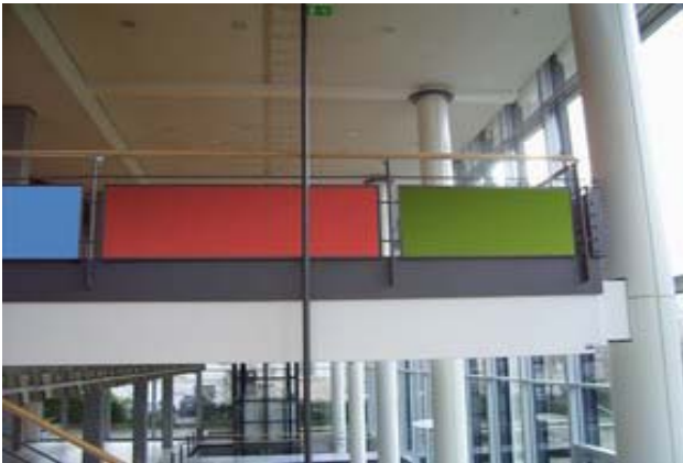
Nr: W-106 (rot) 1. OG Foyer Geländer

Material: Papier, Stoff (< 1 kg) Befestigung: Power-Strips, Kabelbinder KEIN DOPPELKLEBEBAND! Höhe: 61 cm Breite: 203,5 cm